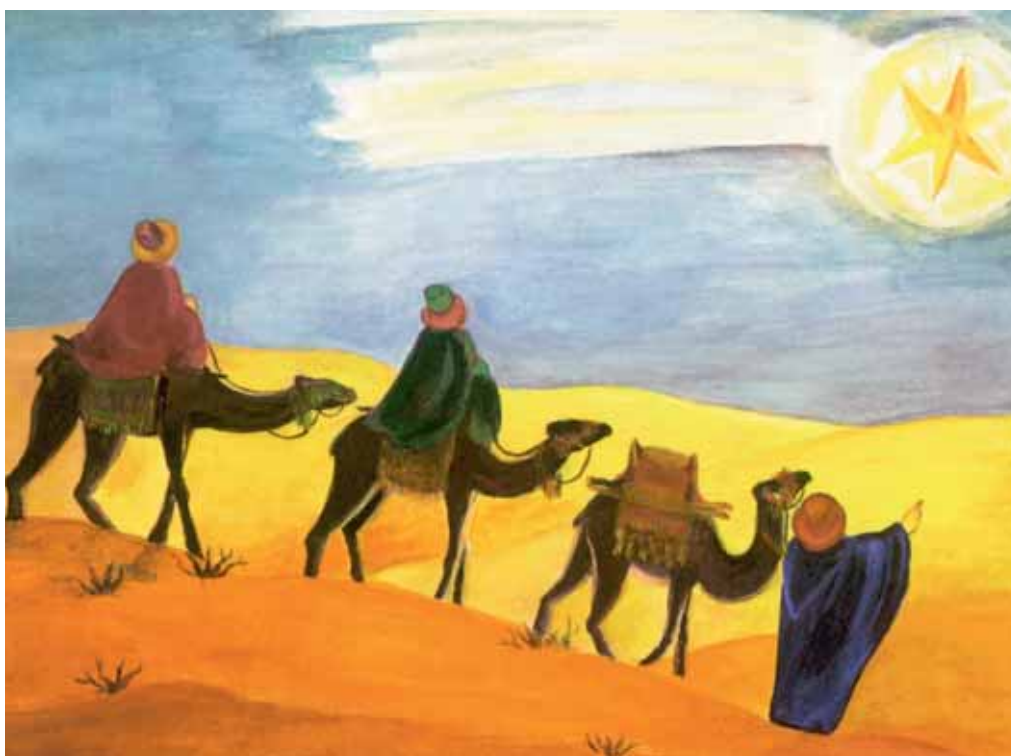
Aus Kinderbibel «Kirche in Not»

auf mein Zimmer, den Korb bekommen die Obdachlosen im Asyl. Die sollen auch einmal was Gutes haben und», jetzt vervollständigte sie den Satz, welchen sie in der gemütlichen Adventsnachmittagsstube verschluckte, «das ersparte Geld kriegen die Armen.»