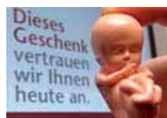
Modell eines ungeborenen Kindes aus dem Lebensschutzmuseum in Schrems.